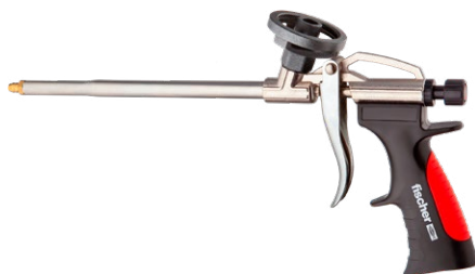
PUP M3 Art. 33208