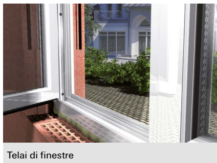
Telai di finestre