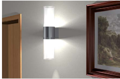
Lampade da parete