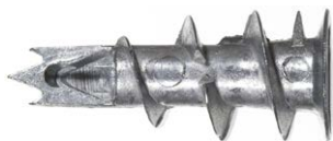
Fissaggio metallico per cartongesso GKM