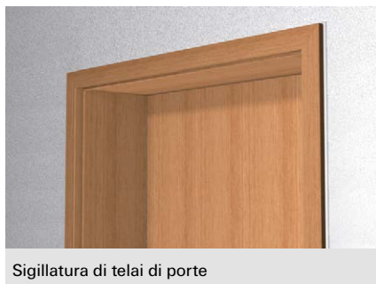
Sigillatura di telai di porte