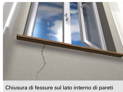
Chiusura di fessure sul lato interno di pareti