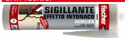
Sigillante effetto intonaco acrilico SAR